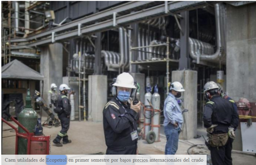
Caen utilidades de Ecopetrol en primer semestre por bajos precios internacionales del crudo

Tras un fuerte 2022, los beneficios en el primer semestre de este año para la industria petrolera se han moderado. Los resultados de Ecopetrol, la empresa más grande de Colombia y fuente fundamental de financiamiento del Estado, reflejan claramente el impacto de la caída del precio del crudo. Según un informe presentado este martes por la estatal, durante el segundo trimestre las utilidades cayeron un 61% y las ventas un 22%, respecto a igual periodo de 2022. Dos cifras aparentemente críticas, pero que no retratan el aceptable conjunto. salud de la operación.