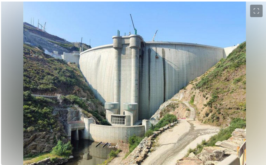
Nota De Prensa: Iberdrola Comenzará A Llenar El Embalse De Alto Tâmega