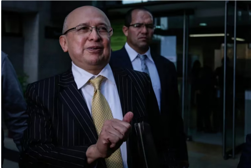
El exfiscal Eduardo Montealegre se ha mostrado cercano al Gobierno de Gustavo Petro.

Por el momento se trata de posibles requerimientos futuros de Roa, debido a que la misma defensa de Nicolás Petro desistió de llamarlo como testigo en el proceso que adelanta la Fiscalía en su contra, así como le solicitó a la Procuraduría no convocarlo para declarar en el proceso disciplinario que se adelanta por los mismo hechos.