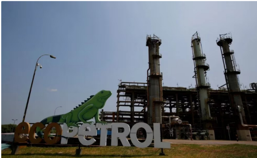
Aunque el desempeño de la compañía se mantiene en niveles históricos, se han disminuido las utilidades durante 2023 en comparación con el 2022.

El balance de operación de Ecopetrol durante el primer semestre de 2023 dejó noticias negativas. Las utilidades netas de la estatal cayeron un 61% para el segundo trimestre, lo que significa un menor nivel de ingresos para la Nación, debido a las transferencias e impuestos que obtiene de la venta del crudo.