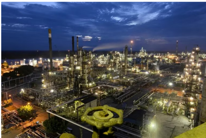
Refinería de Cartagena tuvo una mayor producción durante el primer semestre de 2023, por lo que permitió amortiguar las bajas.

En el balance, la estatal atribuyó la situación del comercio de combustibles en el país a varios factores. Señalaron que se produjo una disminución de la demanda por el incremento de precios, así como la situación de las aerolíneas en el país que causó la salida de algunas empresas de bajo costo y se presentó una situación atípica que requirió esfuerzos para transportar turistas.