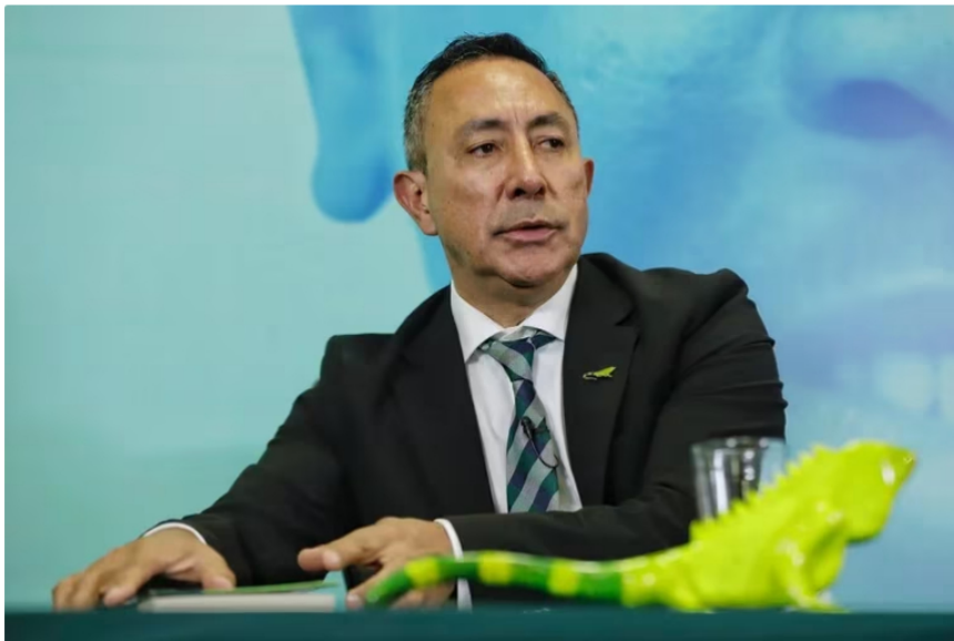
Ricardo Roa Barragán, presidente de Ecopetrol .

Un golpe muy fuerte recibió Ecopetrol tras conocerse el informe de resultados financieros y operativos del segundo trimestre del 2023 (abril - mayo - junio), lo cuales no fueron muy buenos, ya que reportó utilidades por $9,75 billones, lo que significó una caída de 42,8% frente al mismo periodo del 2022.