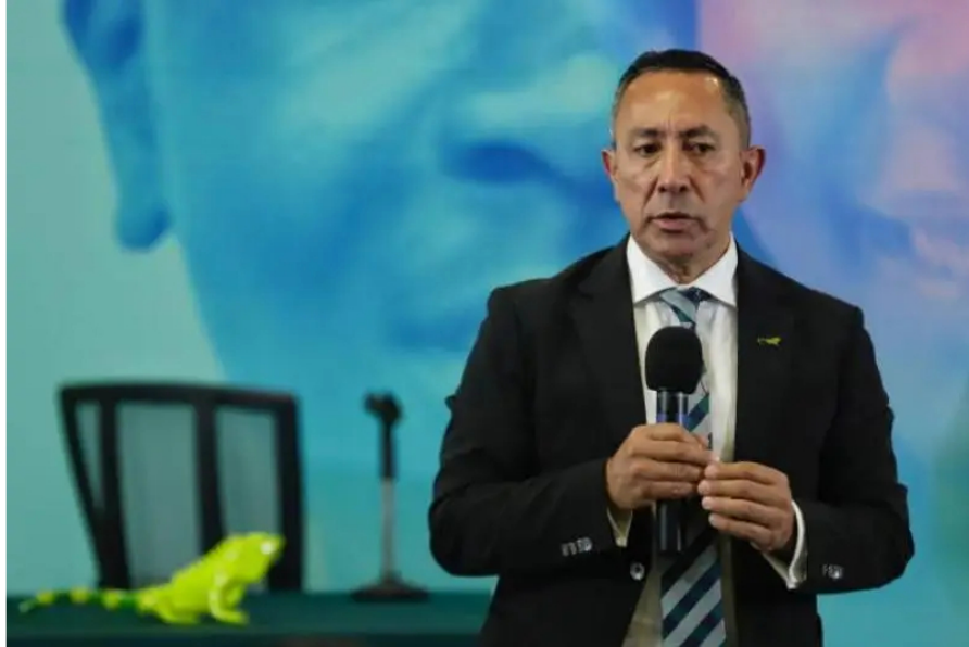
Ricardo Roa, presidente de Ecopetrol , habló luego de los resultados de la compañía.

INICIO / COLOMBIA / PRESIDENTE DE ECOPETROL RESPONDE SOBRE LA CAÍDA DE GANANCIAS DE LA ESTATAL PETROLERA