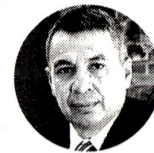
William Camargo Ministro de Transporte

Fuente: Creg, MinHacienda, MinEnergía / Gráfico: LR-ER