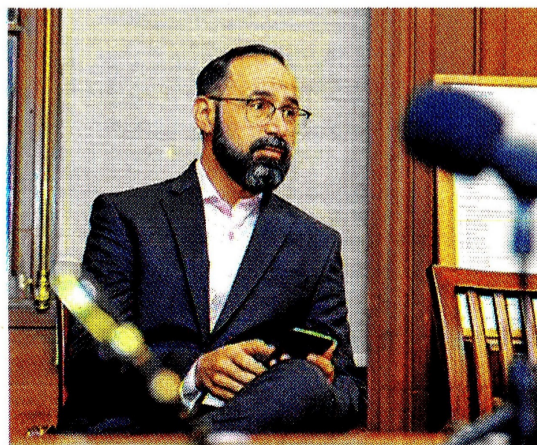
El ministro de Minas y Energía, Andrés Camacho

“Tenemos que empezar a buscar y desarrollar geoter-