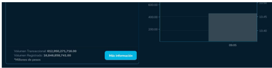
La Bolsa de Valores de Colombia y Ecopetrol iniciaron la semana con poco movimiento y mucha expectativa entre los operadores.