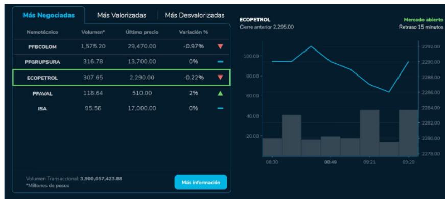
En medio de un entorno económico desafiante, Colombia se prepara para enfrentar los próximos meses con expectativas cautelosas sobre la inflación, las tasas de interés y el crecimiento económico.

En medio de un entorno económico desafiante, Colombia se prepara para enfrentar los próximos meses con expectativas cautelosas sobre la inflación, las tasas de interés y el crecimiento económico. Tras un segundo trimestre del año, caracterizado por una moderación en el crecimiento, los analistas e instituciones financieras están atentos a los indicadores clave que podrían marcar el rumbo de la economía en lo que resta del año.