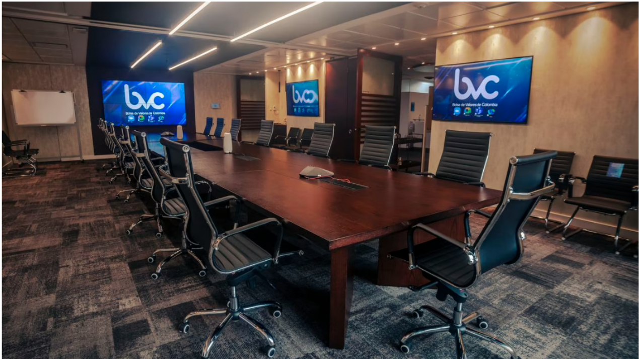
Esta es una jornada de expectativa por los nuevos datos de costo de vida para julio.

La Bolsa de Valores de Colombia y Ecopetrol iniciaron la semana con poco movimiento y mucha expectativa entre los operadores. Luego de varias jornadas negativas y desplomes en gran parte de sus indicadores, el mercado bursátil arrancó con la atención puesta en el nuevo dato de inflación que será presentado por el Dane al cierre del día, así como los nuevos balances para la petrolera estatal, que ya cumplió un año bajo la tutela del presidente Gustavo Petro y actualmente enfrenta varias polémicas ante la opinión pública.