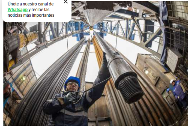
Imagen de referencia.