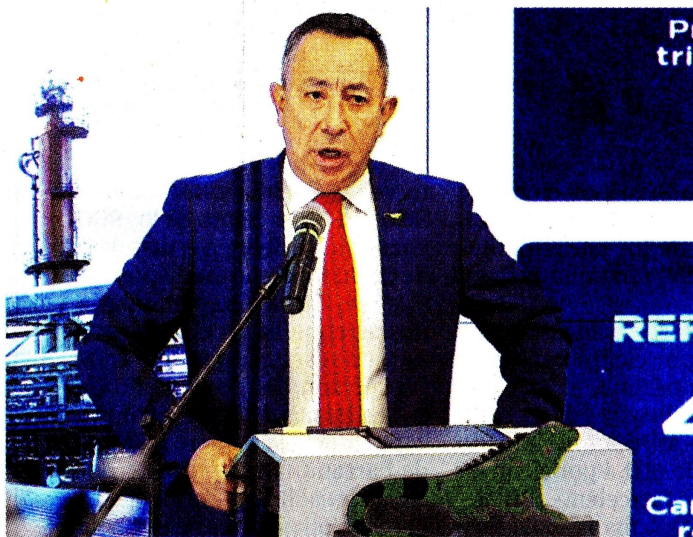
El presidente de Ecopetrol, Ricardo Roa, explicó ayer durante una rueda de prensa las razones de la caída de las utilidades.

2022. Además, su ebitda fue de 32,4 billones de pesos, y su margen ebitda, de 44,3 por ciento.