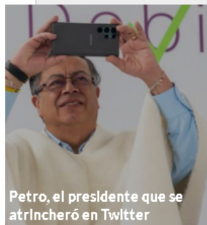
Petro, el presidente que se atrincheró en Twitter