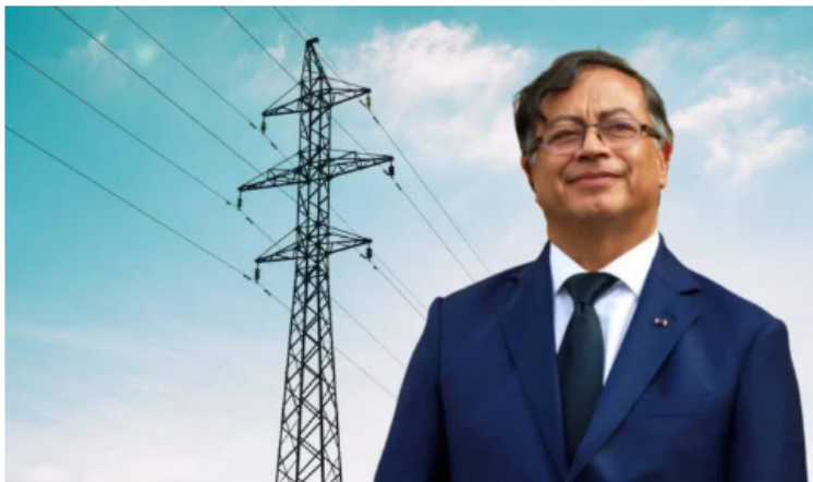
Primer año de Petro: Así ha sido la gestión en el sector minero-energético.

La cartera minero-energética de Colombia fue una de las más turbulentas en el primer año del Gobierno del presidente, Gustavo Petro, por varios cambios, crisis y polémicas que hubo alrededor de los hidrocarburos. ¿Cuáles fueron los logros?