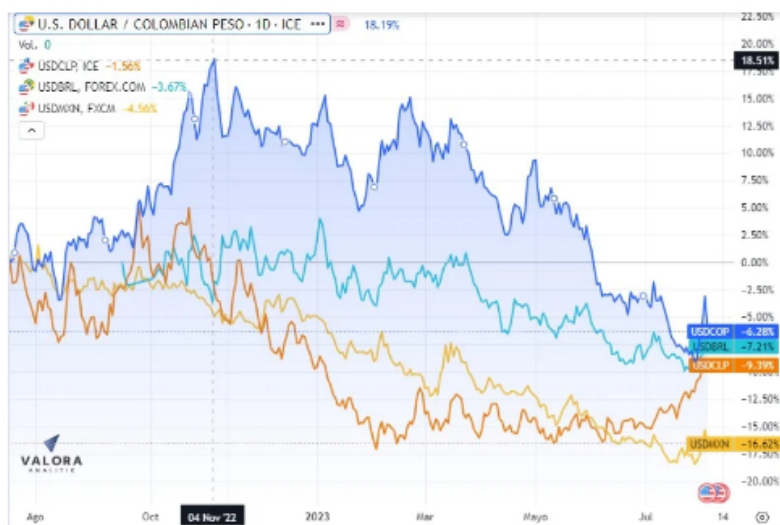
Comportamiento del dólar en Colombia dentro del gobierno Petro y frente a pares regionales. Imagen: Valora Analitik

Sin embargo, mientras la devaluación en Colombia era cercana al 18 %, en noviembre del año pasado, en economías pares como México, Chile o Brasil el ritmo de depreciación iba al 5 % o menos.