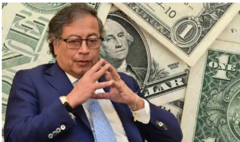
El presidente Gustavo Petro pidió a los bancos reducir sus tasas.

El dólar en Colombia ha sido, a ojos del mercado, uno de los medidores más importantes sobre la percepción del gobierno del presidente Gustavo Petro.