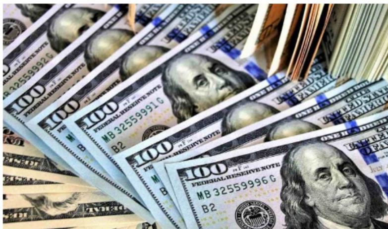
El dólar en Colombia.

La historia del último año entre el gobierno Petro y el dólar en Colombia se traduce en un escenario internacional que, efectivamente, pone presiones extra al país, pero que ha estado acompañado de declaraciones del mandatario que han llevado a profundizar la recurrente volatilidad de la divisa estadounidense.