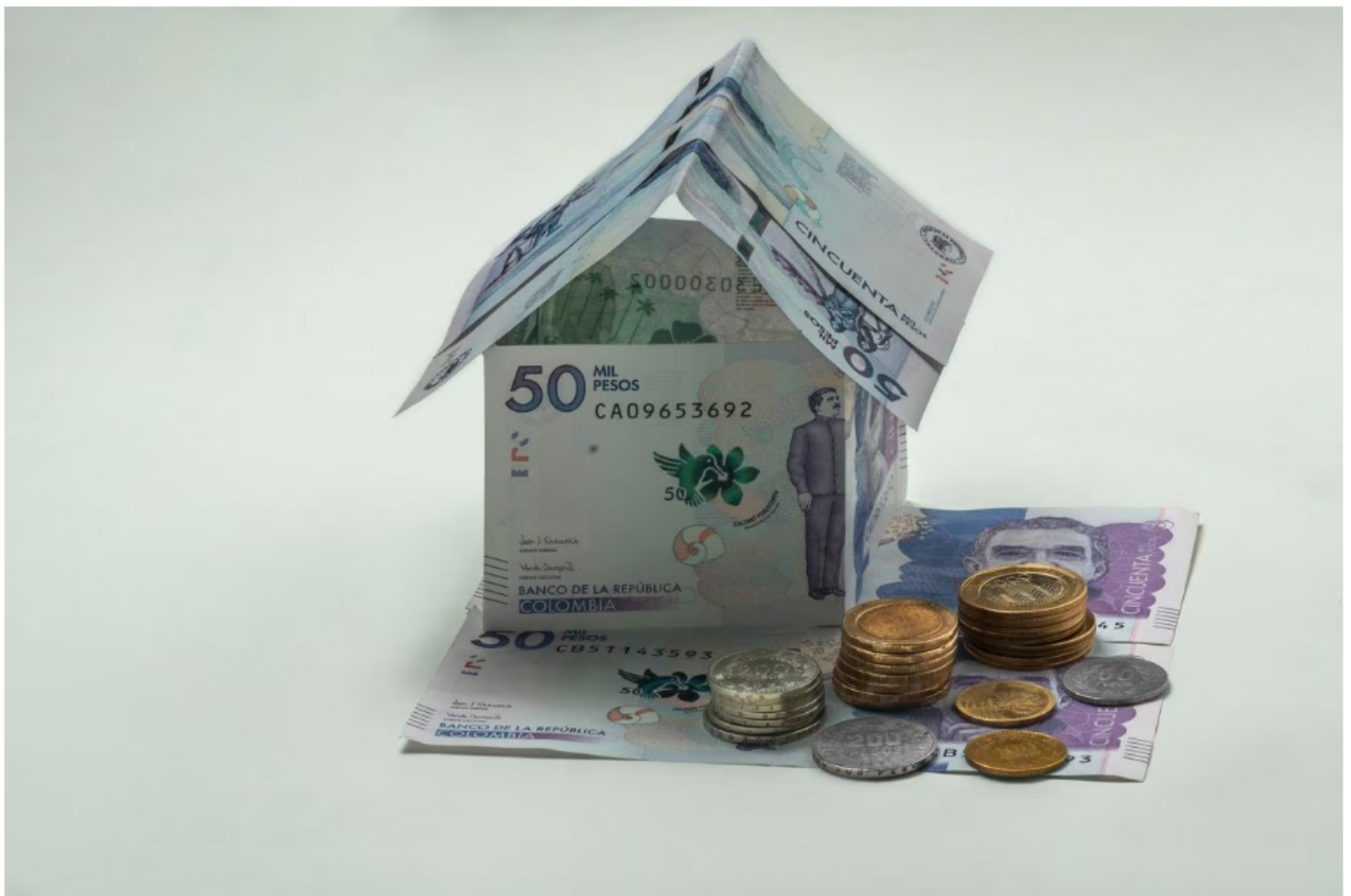
Los bonos pensionales son regidos por el Ministerio de Hacienda.

Así las cosas, de acuerdo con el Ministerio de Hacienda, entidad encargada de establecer los lineamientos sobre esta figura, al bono pueden acceder todos aquellos trabajadores que hayan efectuado cotizaciones durante un mínimo de 150 semanas, tres años, antes de cambiar de fondo de pensión. Pero además, se requiere tener una edad mínima para hacerlo efectivo; en el caso de los hombres son 62 años, mientras que para las mujeres son 60 años.