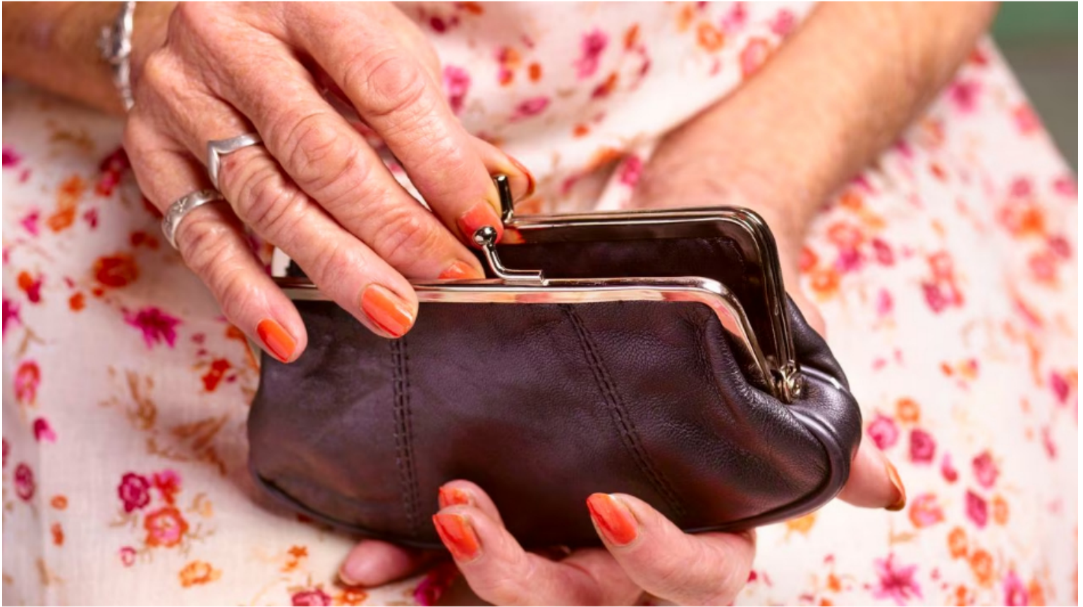
Pensiones / Pensión / Pensionado