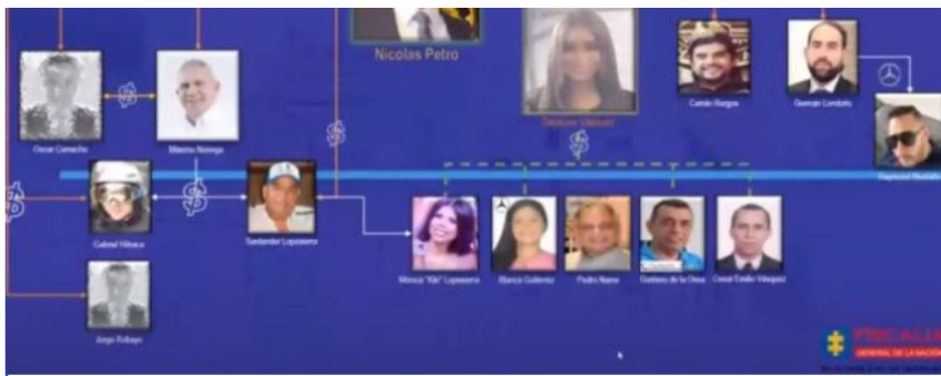
Organigrama de caso Nicolás Petro presentando por la Fiscalía,