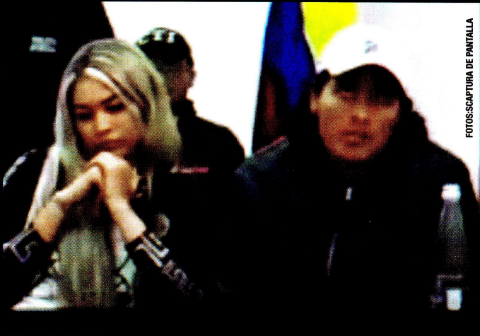
FOTOCAPTURA DE PANTALLA