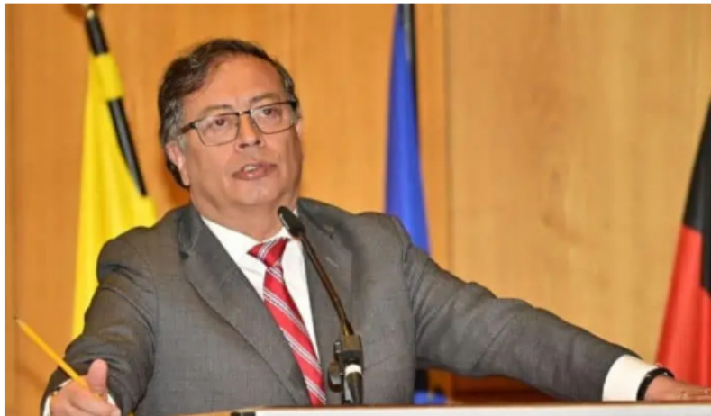
El presidente de Colombia, Gustavo Petro.

El presidente Gustavo Petro, en medio del revuelo por las declaraciones de su hijo Nicolás y la presunta llegada de dineros ilícitos a su campaña, recordó una denuncia en la que advertía de un plan para afectarlo.