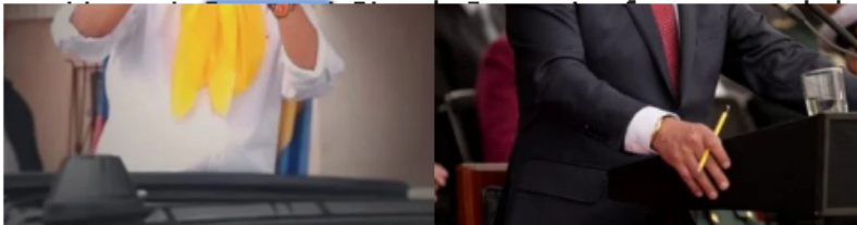
Nicolás Petro habla del dinero que entro a la campaña del presidente Gustavo Petro.

Voces políticas han pedido incluso la renuncia del ahora