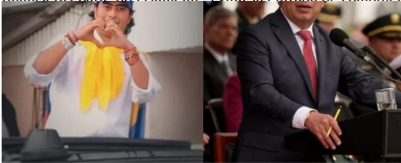
Nicolás Petro habla del dinero que entro a la campaña del presidente Gustavo Petro.

Según el mandatario, todo se financió mediante instituciones financieras para precisamente evitar la entrada de cualquier