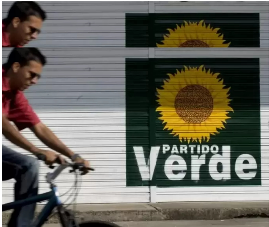
Partido Alianza Verde.