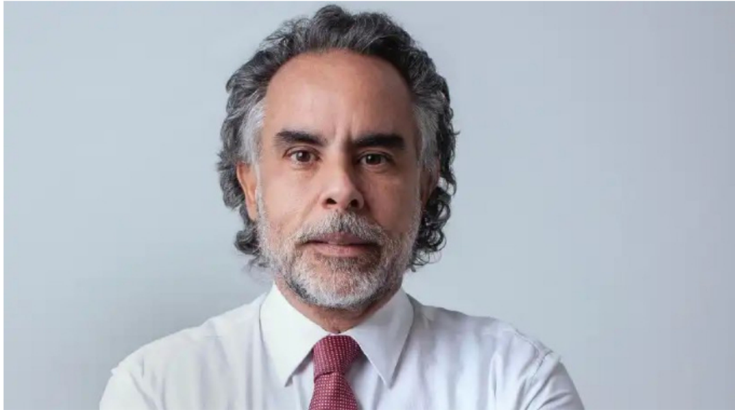
Armando Benedetti, Colombia.

La mano derecha de Petro en la campaña electoral fue nombrado embajador en Venezuela cuando Gustavo llegó a la Presidencia. Sin embargo, Benedetti, conocido político con mucha influencia en el Atlántico y sus clases políticas, salió de ese puesto hace dos meses tras un escándalo con la exjefa de gabinete de Petro, Laura Sarabia .