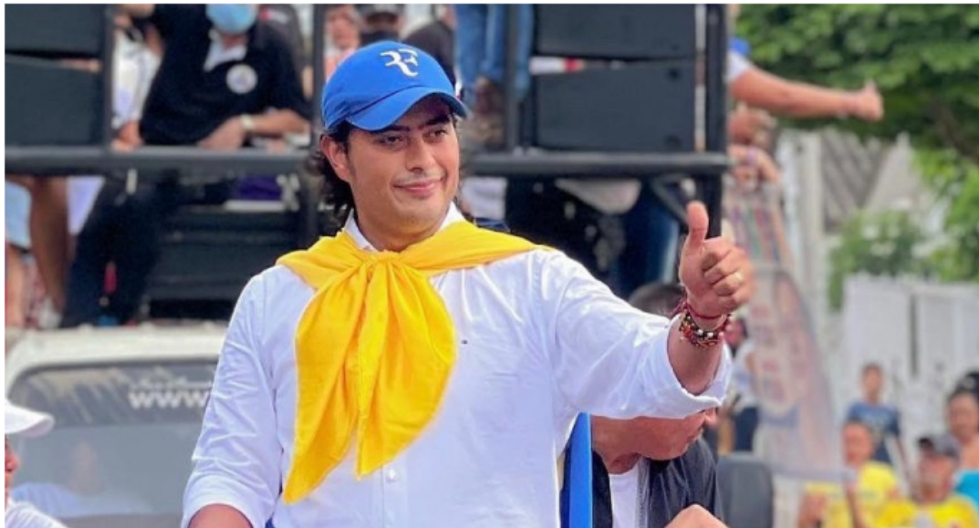
Nicolás Petro Burgos.

El escándalo por corrupción en Colombia tiene como principales protagonistas a Nicolás Petro Burgos , y su padre, el presidente Gustavo Petro . De todas maneras, muchos otros nombres fueron señalados en los dos días de audiencias desarrolladas en el búnker de la Fiscalía, donde el primogénito está detenido desde el sábado.