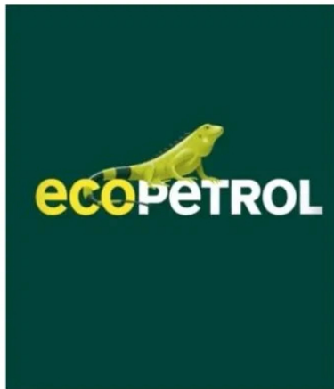
Piden renuncia de Ricardo Roa de Ecopetrol por presuntos dineros ilícitos en campaña de Gustavo Petro.

Ante la Fiscalía, Nicolás Petro aseguró que durante la campaña de su padre, el presidente Gustavo Petro , ingresaron fondos ilícitos. Según lo revelado en el proceso, el dinero que poseía Nicolás habría formado parte de la campaña en 2022 y se habría obtenido a través de actividades ilegales.