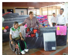
3 agosto, 2023 Huila crece apoyando a los deportistas de los