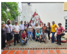
3 agosto, 2023 Impulso gerencial a la asociatividad cafetera