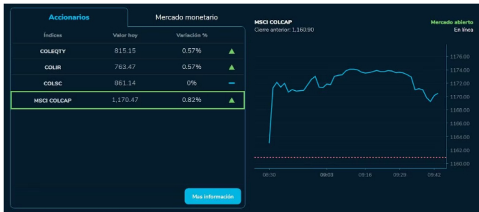
De acuerdo con los primeros reportes para esta oportunidad, el índice MSCI Colcap se ubica por ahora en las 1.170,47 unidades, creciendo de esta forma un 1,82 % respecto a las 1.160 que marcan la referencia.

ahora en las 1.170,47 unidades, creciendo de esta forma un 1,82 % respecto a las 1.160 que marcan la referencia. Este indicador comenzó el día en terreno positivo y rápidamente se disparó hasta máximo 1.174, para luego mantenerse cerca de este nivel, dando un parte de tranquilidad a los operadores, quienes esperan que no se corrija la tendencia y en este día se recupere parte del terreno cedido en días anteriores,