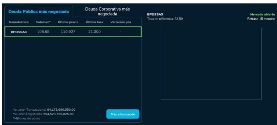
La Bolsa de Valores de Colombia y Ecopetro dieron una buena noticia a los inversionistas, analistas y expertos, luego de que este jueves, 3 de agosto, arrancaron la jornada con fuertes repuntes en sus diferentes indicadores.

La calificadora de riesgo Fitch degradó el martes un escalón la nota de la deuda de Estados Unidos, del máximo AAA a AA+, pero el impacto en la mayor economía del mundo será más que nada simbólico, al menos a corto plazo. Fitch atribuyó el recorte a una "erosión de la gobernanza", luego de los retrasos de las negociaciones en el Congreso sobre el límite de endeudamiento y los acuerdos de último minuto para evitar un default.