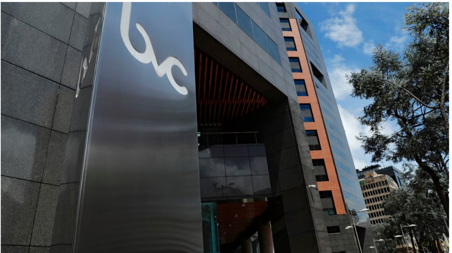
Este mercado busca aprovechar el optimismo que crece entre los operadores.

La Bolsa de Valores de Colombia y Ecopetrol dieron una buena noticia a los inversionistas, analistas y expertos, luego de que este jueves, 3 de agosto, arrancaron la jornada con fuertes repuntes en sus diferentes indicadores, impulsados por el optimismo que hay entre los inversionistas, que ahora tienen su atención puesta en lo que pasará con el costo de vida en Colombia y las reacciones en el mercado internacional, tras la baja en la calificación de riesgo para Estados Unidos por parte de Fitch Ratings.