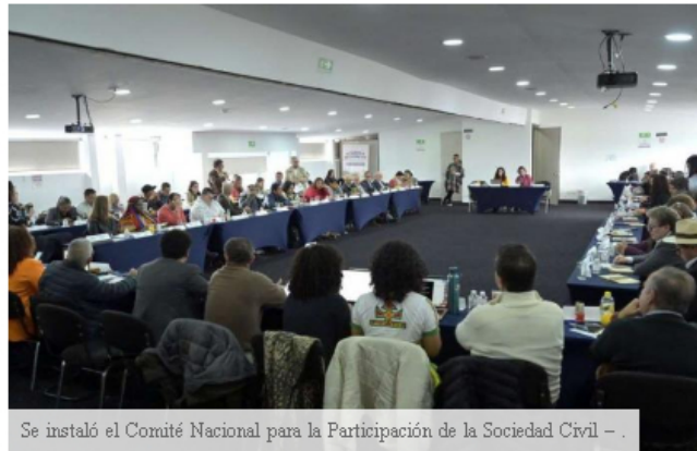
Se instaló el Comité Nacional para la Participación de la Sociedad Civil – .

Instalación del Comité Nacional de Participación en el proceso de paz con el ELN.