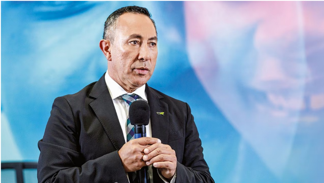
Quien se desempeñó como gerente de la campaña de Gustavo Petro es hoy el presidente de Ecopetrol . | Foto: juan carlos sierra-semana

3 de agosto de 2023 Por: Redacción El País