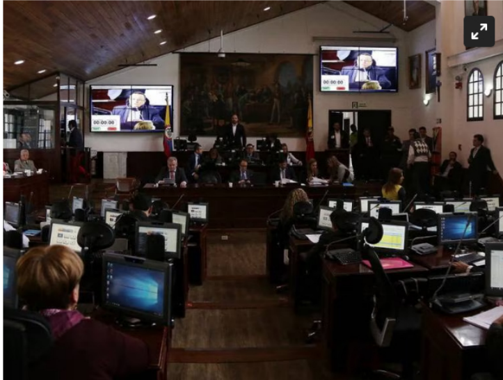
Concejo de Bogotá

Además, piden que se revise la actuación de su entonces gerente de campaña y hoy presidente de Ecopetrol .