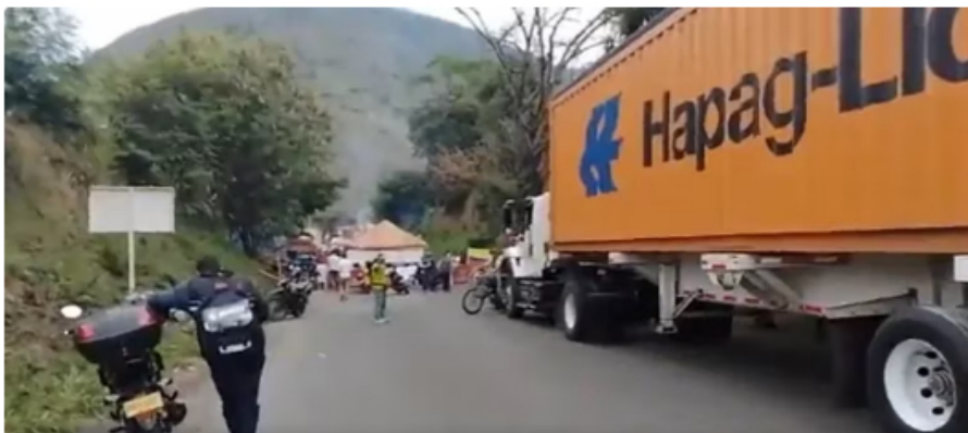
Bloqueos Ruta del Sol por mal estado de la vía.

Los constantes bloqueos que se presentan en la Ruta del Sol , en la vía que conecta a Bucaramanga con Barrancabermeja, han convertido este trayecto en un dolor de cabeza para las personas que la transitan, ya que quedan sin poder movilizarse por las protestas de la comunidad que exigen que se le haga mantenimiento a la malla vial.