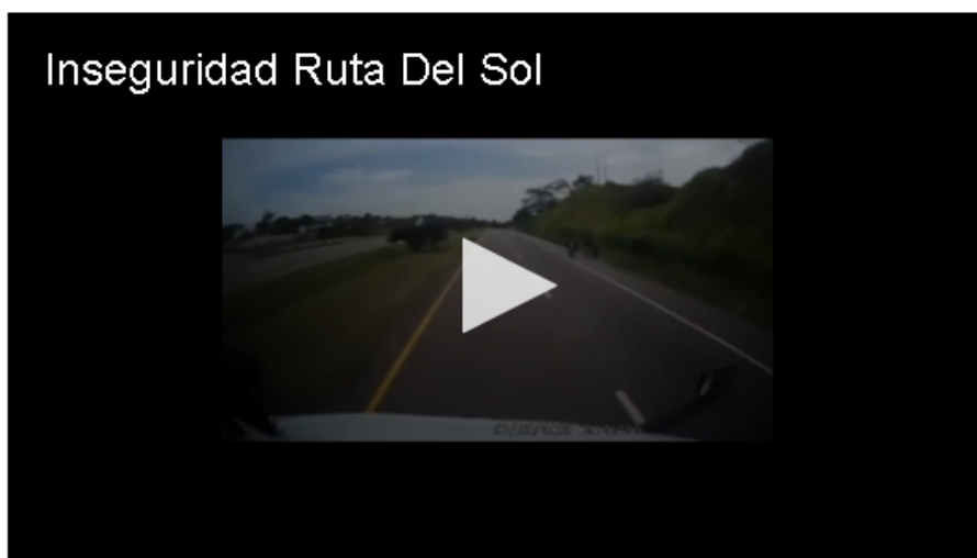
Inseguridad en la Ruta del Sol

En las últimas semanas se han conocido una serie de imágenes en la Ruta del Sol en las que se ve como un grupo de personas se posa sobre la carretera buscando impedir el paso de quienes se transportan por esta artería vial del país.