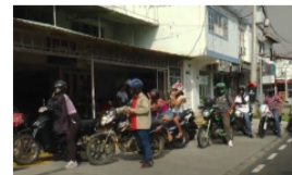
Reiteran solicitud a Ministro de Minas y Energía para abastecimiento de combustible