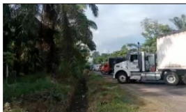
Transportadores inconformes por bloqueos en vías nacionales de Santander