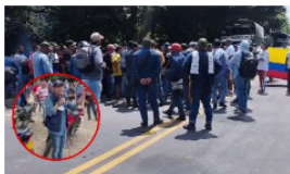
Defensor del pueblo pidió que se respete la misión médica en bloqueos