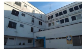
Hospital Regional declara alerta naranja por bloqueos en vía nacional