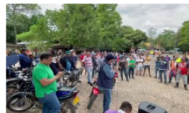
"A la gobernación de Santander le quedó grande": líder de bloqueos