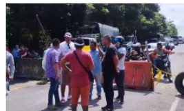
Sector empresarial de la región se ve afectado por bloqueos