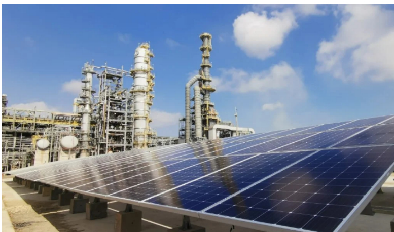
Gobierno Petro autorizó a Ecopetrol para generar energía con fuentes renovables no convencionales.

Los beneficios tributarios establecidos en la Ley 1715 de 2014, modificada por la Ley 2099 de 2021, establecidos para Fuentes no Convencionales de Energías Renovables (FNCER), serán aplicables a los proyectos de almacenamiento de energía eléctrica, de baterías y de estabilidad de la red en La Guajira.