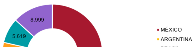
Figura 2. Principales inversores latinoamericanos en España por países (stock en millones de euros)

España es uno de los países del mundo con mayor apertura económica , medida tanto por el comercio como por la entrada y salida de IED. Es la 12ª economía del mundo en IED recibida –posición muy similar a su importancia en tamaño económico– con 819.000 millones de euros y 6.796 compañías extranjeras operando en el país, que emplean 1.697.000 personas. Un inversor muy relevante es América Latina, con 68.361 millones de euros de inversión acumulada, incluyendo las posiciones de holding (Entidades de Tenencia de Valores Extranjeros o ETVE, según su denominación jurídica en España). Esto convierte a América Latina en el cuarto mayor inversor en España si se le considera de forma conjunta, sólo por detrás de EEUU, el Reino Unido y Francia. México es el primer inversor de renta media en España, por encima de China. Un total de 20 países latinoamericanos cuentan con inversiones en España (ver Figura 2) y Argentina, Brasil, Colombia y Venezuela tienen una inversión significativa.