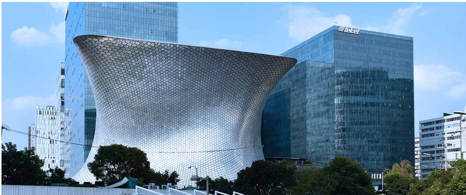
Complejo de Plaza Carso en Ciudad de México, con el museo Soumaya en primer plano y la Torre Telcel, sede de América Móvil.