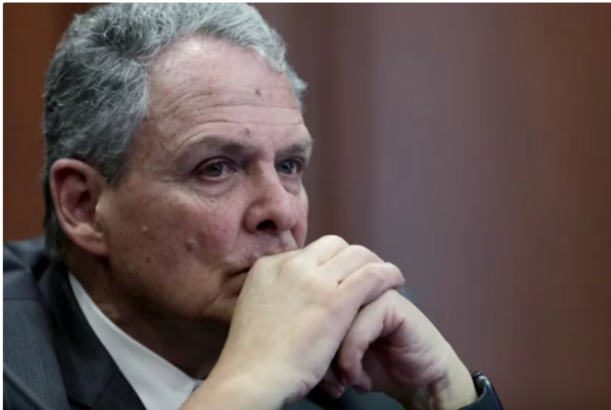
Juan José Echavarría, miembro de la Junta Directiva de Ecopetrol y exgerente del Banco de la República.

La Fiscalía General de la Nación investiga a 17 prestigiosos empresarios del país involucrados en el sonado caso de contrabando de petróleo en Colombia, el cual involucra de manera directa a Ecopetrol , compañía estatal que habría perdido USD80 millones, según el presidente Gustavo Petro.