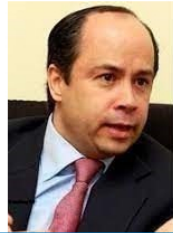
Por FRANCISCO JOSÉ LLOREDA