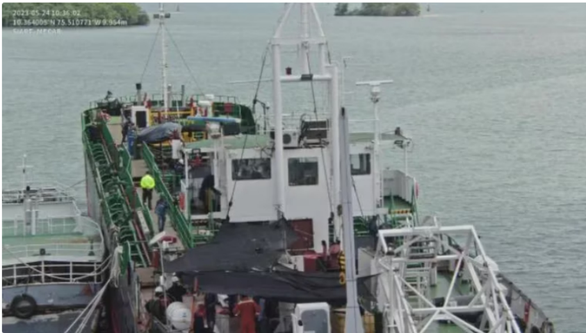
Operativo Dijin caso robo petróleo a Ecopetrol

Avanza la investigación sobre el robo por más de 80 millones de dólares a la estatal de hidrocarburos, Ecopetrol , en el que estarían involucrados el ELN, 17 prestigiosos empresarios y al menos 40 compañías, entre ellas, la multinacional holandesa dedicada a la comercialización de productos petrolíferos Gunvor , y su filial en Colombia, Gunvor Colombia S.A.S.