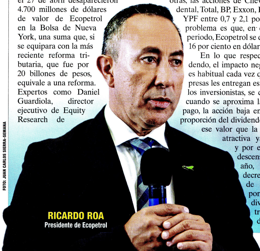
RICARDO ROA Presidente de Ecopetrol

En general, lo que preocupa a los operadores es que se normalice el manejo político y no técnico en la mayor empresa del país, que, al ser petrolera, no puede decir que no le interesa explorar más, eso debe ser un mensaje del Gobierno, no de la compañía. “Una de las principales funciones de los directivos de una empresa es transmitir tranquilidad al mercado y no sumar más incertidumbre”, dijo un comisionista en un Space (sala de audio) en Twitter, en el que varios de ellos se reunieron para analizar la situación de Ecopetrol y reiterar que, en este caso, como en muchos otros, importa tanto lo que se diga como la manera en que se diga. ■