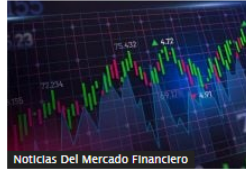
Noticias Del Mercado Financiero

Petro insistió en cierre de Asofondos en que "las AFP ya no financian a la Nación"