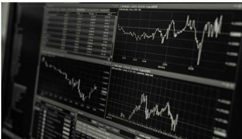
La tendencia está inmersa en la volatilidad de las principales bolsas del mundo ante el alza de tasas de interés y creciente inflación.