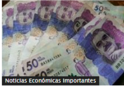
Noticias Económicas Importantes

Peso colombiano, la segunda moneda más devaluada de A. Latina durante abril