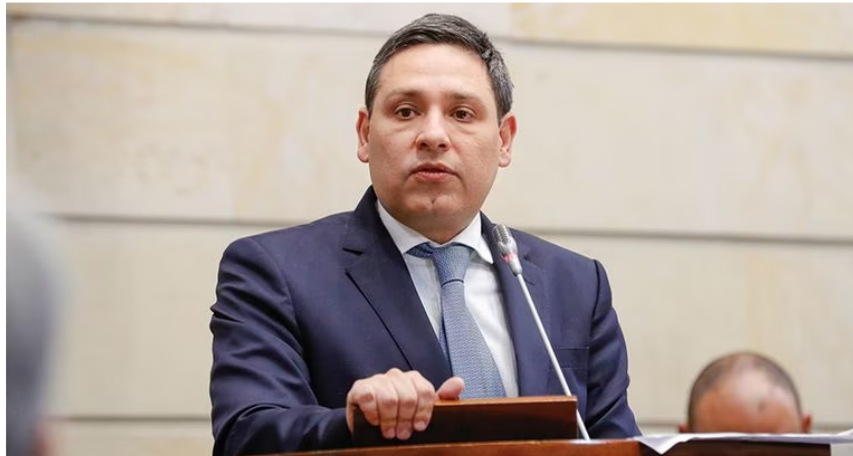
Mauricio Lizzcano será el nuevo ministro de las TIC.

El futuro de la fuerza pública también está en juego tras la barrida de más de 60 generales, el ruido sobre una baja de la moral en las tropas y los constantes señalamientos por la disminución en la operatividad. Petro está empeñado en la interdicción y ha dejado en un segundo plano la erradicación de la coca, por lo que se espera que el país muy pronto llegue a la cifra de 300.000 hectáreas sembradas o más, algo impensable. Esto se convierte en un arma de doble filo para el presidente, pues a más cocaína, más combustible para la violencia en el país.