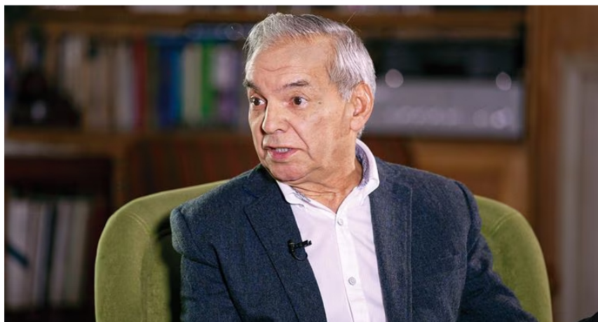
Ricardo Bonilla es el nuevo ministro de Hacienda.