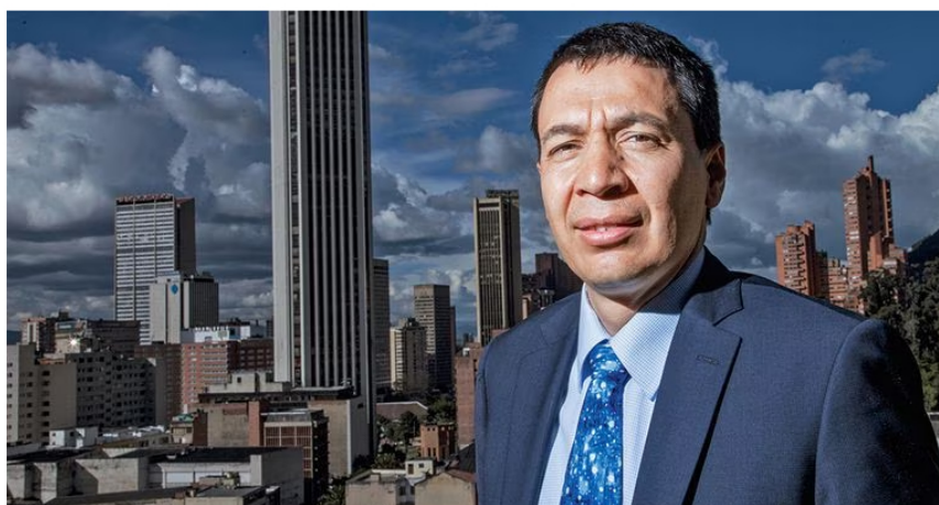
William Camargo es el nuevo ministro de Transporte.

Con la crisis de gobierno, de forma paralela, esta semana el dólar se volvió a disparar y el viernes cerró en 4.669,65. Las noticias por el lado de Ecopetrol tampoco son buenas. Tras la llegada de su nuevo presidente, Ricardo Roa, y sus primeras declaraciones, la acción de la empresa perdió esta semana 0,13 por ciento de su valor. El viernes cerró en 2.288 pesos, 32 pesos menos que lo que valía el lunes. La devaluación del peso también fue estrepitosa: en la semana bajó 146 pesos, lo que implica una caída de 3,23 por ciento.