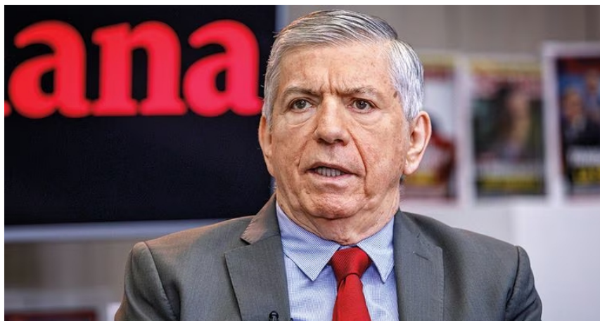
El expresidente César Gaviria, líder del Partido Liberal, ha tenido diferencias con Petro.

El segundo camino de Petro es preocupante y puede poner en riesgo la democracia. El país estaría frente a un presidente que, ante el fracaso, podría optar por una vía autoritaria y gobernar mediante decretos, dejándose arrastrar por voces de una izquierda radical que promueven una riesgosa constituyente, que, sin duda, sería un salto al vacío y reviviría el traumático fantasma de la reelección. Las palabras del expresidente Gaviria podrían convertirse, entonces, en premonitorias: "A (Petro) le va a dar trabajo entregar el poder, me da temor". En este oscuro escenario, Petro apostaría por las calles como su tabla de salvación con el fin de presionar al Congreso y a las instituciones en un ambiente de caos y anarquía. El mandatario es un buen orador, así lo demostró en la campaña y cuando fue congresista. La protesta es su hábitat natural y es claro que lo seduce. Pero el presidente sabe que violentar la democracia lo puede llevar a una confrontación con todos los poderes públicos, al igual que con las altas cortes. De hecho, la Corte Constitucional ya le mostró los dientes al anunciar que podrá tumbar, de manera preventiva, cualquier ley que apruebe el Congreso y que se considere lesiva para el interés general.