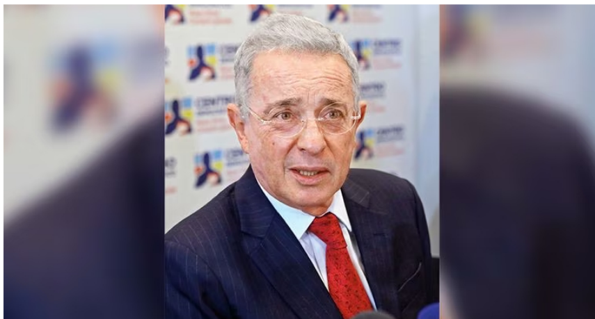
El ex presidente Álvaro Uribe sostuvo diferencias públicas con Petro por la reforma de salud.

Aunque Petro no fue desobligante con Uribe, sí le dedicó varios trinos y, en uno de ellos, le dijo: “Expresidente, ¿para qué quiere que las EPS privadas manejen los dineros públicos? ¿SÍ sabe que eso lleva a desatender pacientes incluso con peligro de muerte y a quebrar hospitales?”. Uribe ha seguido alertando sobre los peligros de la reforma a la salud sin caer en una pelea personal con Petro.