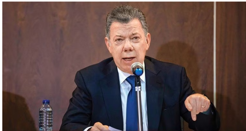
El expresidente Juan Manuel Santos hizo críticas a las decisiones de Petro.

El abrupto remezón ministerial promovido por el presidente Gustavo Petro ante la negativa de los partidos de aprobar su polémica reforma a la salud marca un antes y un después en su Gobierno. Los colombianos podrían estar empezando a conocer a un mandatario más radical, dispuesto a sacar adelante sus proyectos a como dé lugar y apoyado en las calles y la presión social. “Se está sintiendo acorralado y en su ADN se vuelve más radical”, advirtió en las últimas horas el expresidente Juan Manuel Santos en varios medios de comunicación.