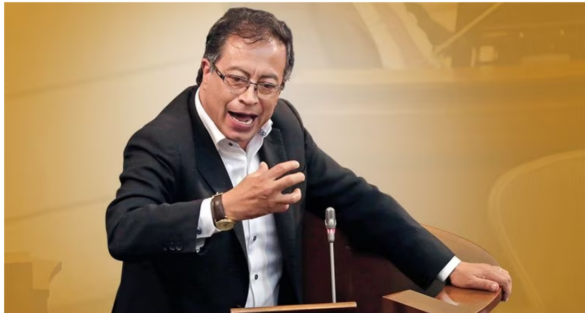
El presidente Gustavo Petro tomó la decisión de mover a varios de sus ministros.

Las encuestas tampoco han estado del lado del mandatario. Según Invamer, solo el 35 por ciento aprueba la gestión del presidente y el 57 por ciento la rechaza. En ocho meses, la aprobación de Petro ha caído 21 puntos porcentuales y la desaprobación ha subido 37 puntos porcentuales. La prueba de fuego serán las elecciones de alcaldes y gobernadores en octubre. Si el respaldo al presidente y su gobierno sigue cayendo, la votación será un plebiscito a la gestión de Petro, que puede dejarlo muy debilitado y poner en aprietos su gobernabilidad.