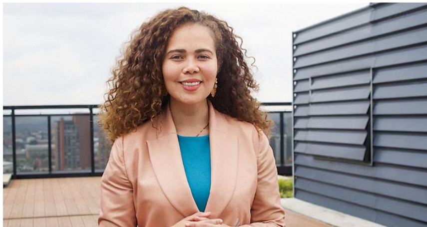
Yesenia Olaya es la nueva ministra de Ciencia, Tecnología e Innovación.

En este complejo ajedrez están los accidentados diálogos con el ELN, que pronto tendrán que empezar a mostrar resultados. En caso de que no ocurra, el presidente perderá la confianza de la opinión en esa apuesta. Las conversaciones con Iván Mordisco, jefe de las disidencias de las Farc, que se inician el 16 de mayo, también se convierten en una papa caliente para el Gobierno. O negocian y se desmovilizan rápidamente, o esos diálogos serán al final un bumerán contra el presidente Petro. Los colombianos no quieren otro Caguán. Mientras tanto, es incierto en qué terminará el plan de dialogar con Iván Márquez y la Segunda Marquetalia, pues no es claro aún si los reincidentes de los diálogos de La Habana pueden tener otra oportunidad para dialogar con el Gobierno o si, por el contrario, la única alternativa que les queda es el sometimiento a la justicia. En la incertidumbre también está lo que ocurrirá con el Clan del Golfo, grupo criminal con el que ya hubo un serio tropiezo cuando el presidente rompió el cese al fuego por el paro armado en el Bajo Cauca.