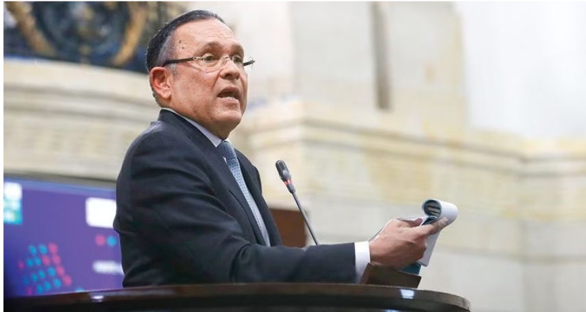
Efraín Cepeda, presidente del Partido Conservador.

presidente está satisfecho con la gestión del ministro Iván Velásquez. En esa área, el primer mandatario debe entender que su política de seguridad estará a prueba, ya que debe sofocar la creciente violencia que azota a las regiones. Está por verse si el cese al fuego es efectivo y logra pacificar el país, teniendo en cuenta que organizaciones sociales han denunciado 219 violaciones a lo acordado entre el Gobierno y distintas estructuras criminales.