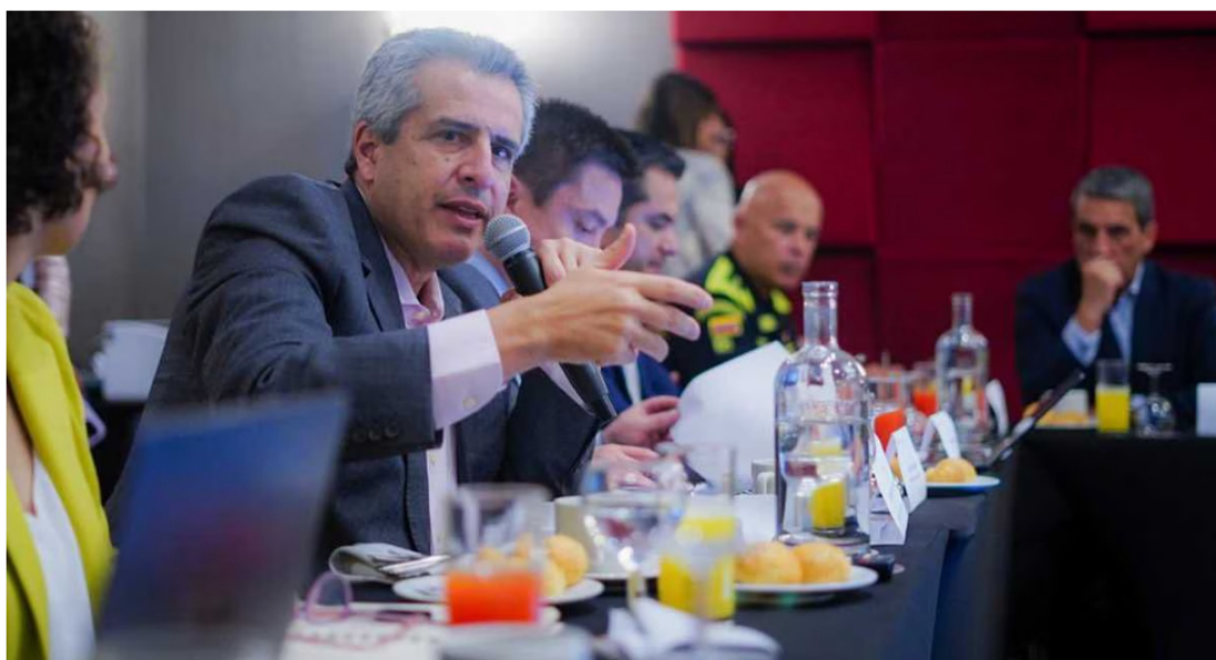
Luis Fernando Velasco, ministro del Interior.

Luis Fernando Velasco, nuevo ministro del Interior, instaló la Comisión Nacional de Fútbol en su primer día en el cargo. Después del evento, el exconsejero para las Regiones habló sobre la apuesta energética del Gobierno y Ecopetrol, centrada en el hidrógeno verde.