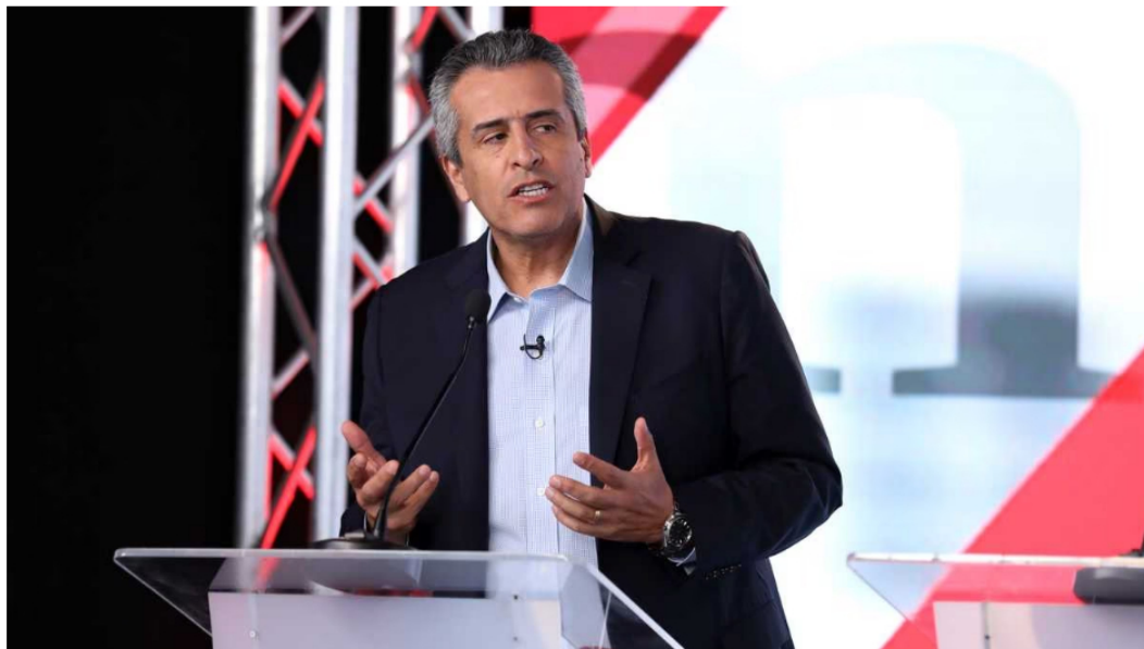
Luis Fernando Velasco, nuevo ministro del Interior.