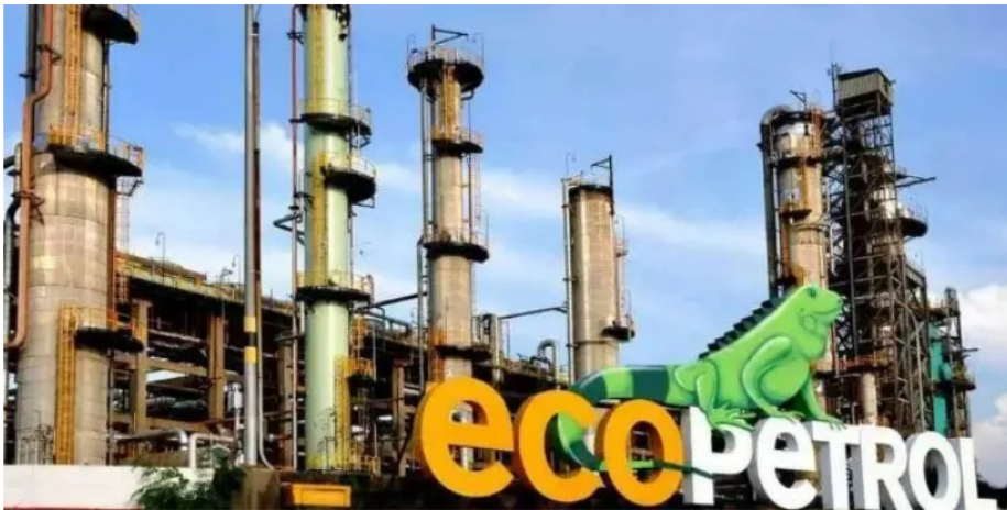
Las acciones de Ecopetrol caen tras los anuncios del presidente Gustavo Petro.

El precio de las acciones de Ecopetrol abrió en el mercado colombiano en $ 2,240 y registraba caídas de hasta $ 55, llegando a $ 2.185.