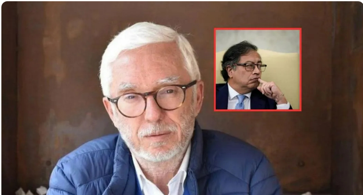
Jorge Enrique Robledo y Petro