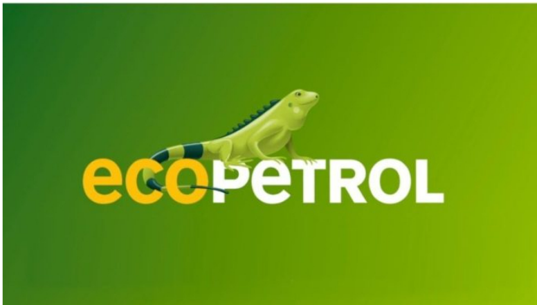
Ecopetrol confirma su Junta Directiva hasta 2025.

Por Yennyfer Sandoval - Periodista Minería y Energía · 2023-04-25