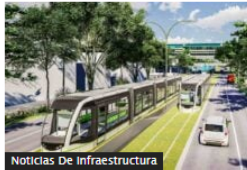
Noticias De Infraestructura Metro de la 80 en Medellín inicia obras: así será el megaproyecto