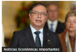
Noticias Económicas Importantes Gobierno Petro buscará revisar acuerdos comerciales vigentes con otros países