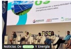
Noticias De Minería Y Energía Gremios dan claves a gobierno Petro para una transición energética organizada en Colombia