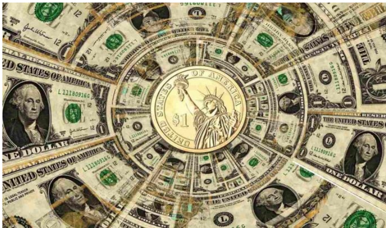
Dólar cierra este martes al alza.