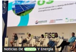
Noticias De Minería Y Energía Gremios dan claves a gobierno Petro para una transición energética organizada en