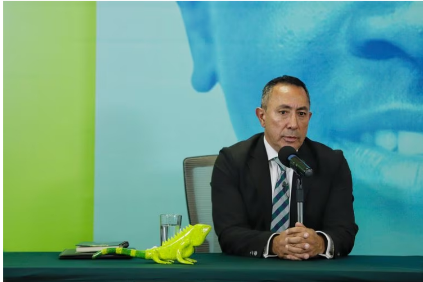
Ricardo Roa Barragán, nuevo presidente de Ecopetrol .

En los contratos existentes, dijo Roa: “Tenemos que ser más exitosos, más eficientes en la búsqueda de petróleo y gas, mejorando las reservas, y cuando se mejoran y hay buenas condiciones de mercado, estas empresas mejoran su valor y son más apreciadas por el mercado”.