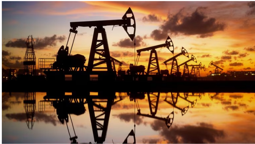
Esta noticia revive los temores de los economistas frente al futuro de la compañía.

En los contratos existentes, dijo Roa: “tenemos que ser más exitosos, más eficientes en la búsqueda de petróleo y gas, mejorando las reservas, y cuando se mejoran y hay buenas condiciones de mercado, estas empresas mejoran su valor y son más apreciadas por el mercado”.