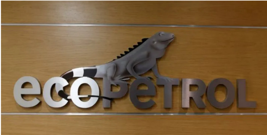
Las acciones de Ecopetrol se desplomaron durante la jornada del viernes.

Durante la jornada de este martes 25 de abril las acciones de Ecopetrol se desplomaron tanto en el mercado colombiano como en el de Estados Unidos.