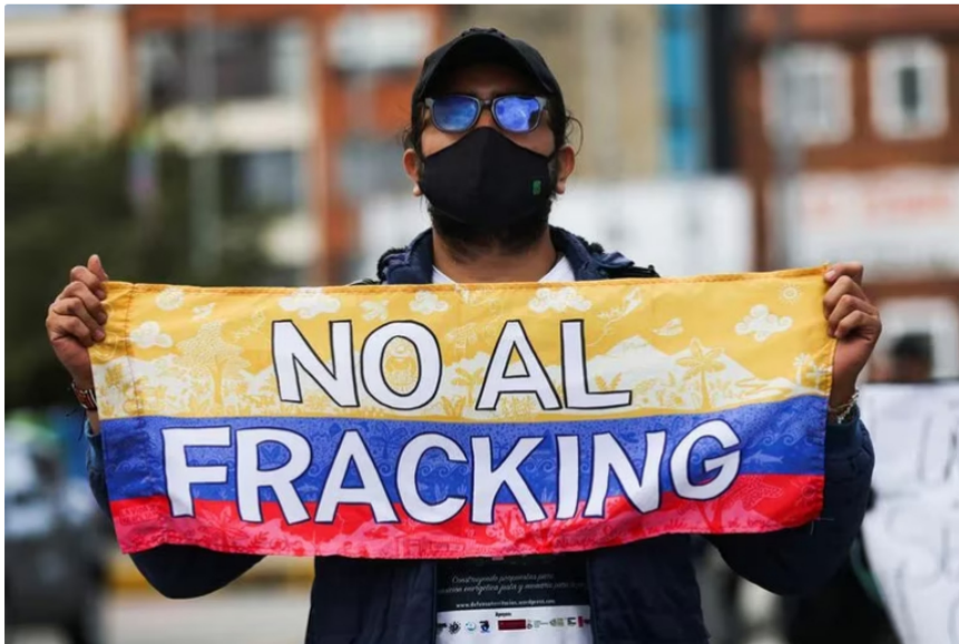
Foto de archivo. Un hombre sostiene una bandera colombiana con la frase "No al fracking" durante una protesta contra los proyectos piloto de explotación de hidrocarburos con esa técnica, en Bogotá, Colombia, 22 de abril, 2022. REUTERS/Luisa González

En cuanto al fracking , Roa indicó que se debe evaluar detenidamente y cuál es el estado actual de los contratos. Cabe mencionar que en el Congreso se discute un proyecto de ley que plantea prohibir esta actividad definitivamente. "Tenemos que mirarlo en los dos contextos: nacional e internacional. Entiendo que Ecopetrol había suscrito unos contratos para hacer pilotos de fracking y debo evaluar cuál es el estado de los contratos", manifestó el nuevo presidente de la empresa más grande de Colombia.