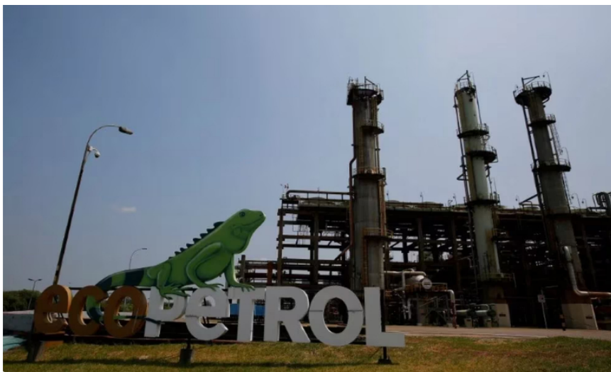
Foto de archivo. Panorámica de la entrada a la Refinería de Ecopetrol en Barrancabermeja, Colombia, 1 de marzo, 2017. REUTERS/Jaime Saldarriaga

El nuevo presidente llega a una empresa con números positivos, según los resultados de operación durante el cuarto trimestre de 2022. Para este periodo reportó utilidades por $33,4 billones , lo que significa que son las más altas de su historia. Además, un Ebitda de $75.2 billones (beneficios de la empresa antes pagar intereses, impuestos y otros gastos), con un margen Ebitda del 47%.