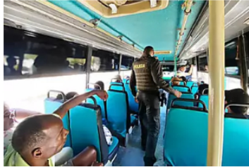
Policía de Cartagena realiza "operativos sorpresa" en buses urbanos y taxis Caracol Radio