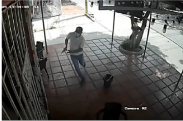
Policía confirma que alentado en licorería de Soledad sería por extorsión Caracol Radio

Promoción de Carros | Enlaces Publicitarios