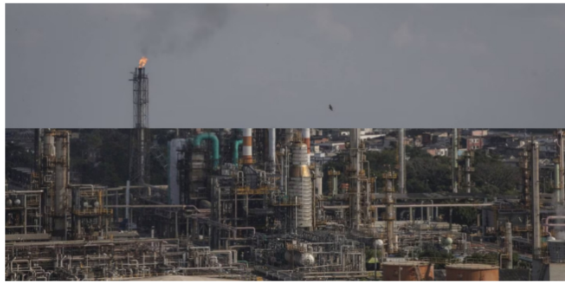
Barrancabermeja La refinería de Ecopetrol Barrancabermeja en Barrancabermeja, Colombia, el martes 15 de febrero de 2022.