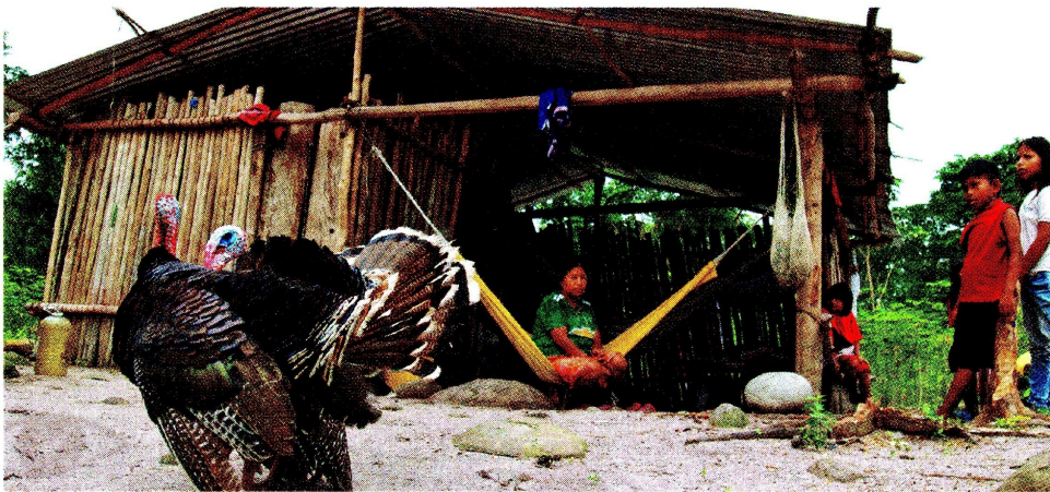
Vivienda U'wa, ubicada a metros de donde ocurrió el último atentado del ELN. / Sebastián Cote

la CorteIDH en 2019, cuando alertó que la justicia internacional podría condenar al Estado colombiano por no garantizar la consulta previa.