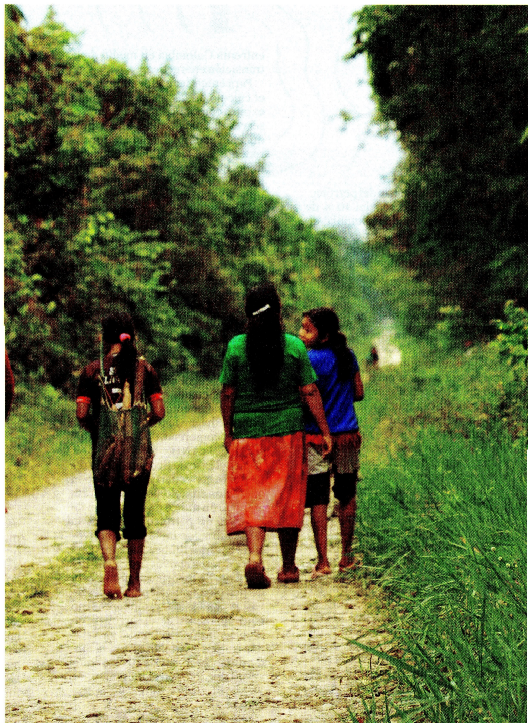
Los u'was son más de 8.000. La mitad de ellos viven en Cubará (Boyacá), donde está la planta de gas Gibraltar y pasa el oleoducto Caño Limón-Coveñas.

➤ Entre las peticiones U'wa a la justicia está mantener la autonomía sobre los recursos del subsuelo de su territorio. Según la Constitución, lo que hay allí, incluyendo el petróleo, es propiedad exclusiva de la Nación.