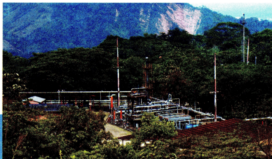
Infraestructura que compone el campo de gas Gibraltar.

Las únicas regalías que entran a Cubará, refiere la Alcaldía, son las que Ecopetrol entrega por el paso transversal de Caño Limón-Coveñas. Dinero que entra en una bolsa común para atender a campesinos e indígenas. Ecopetrol señala que han trabajado en “diálogo constante con las comunidades y la inversión socioambiental”.