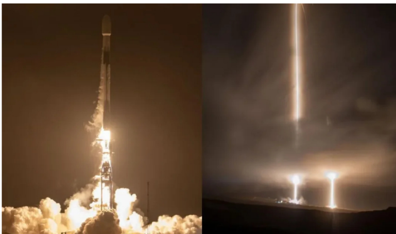
El satélite tomará imágenes sobre el territorio nacional.

El FAC SAT2 Chiribiquete despegó desde el Space Launch Complex 4E, en la Base de la Fuerza Espacial Vandenberg en California, Estados Unidos, una nueva misión de la empresa SpaceX de Elon Musk .