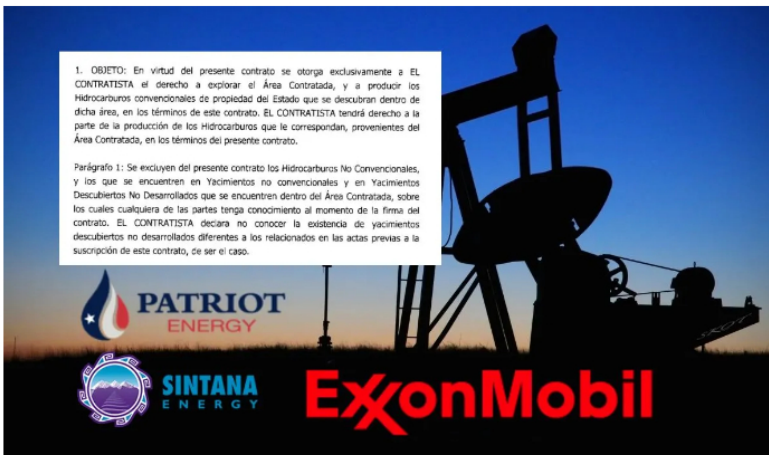
ExxonMobil chantajea al Estado colombiano con el Fracking.

La Silla Vacía, ColombiaCheck, no desmentirán esta noticia porque son amigos de la prensa tradicional y sus financiadores.