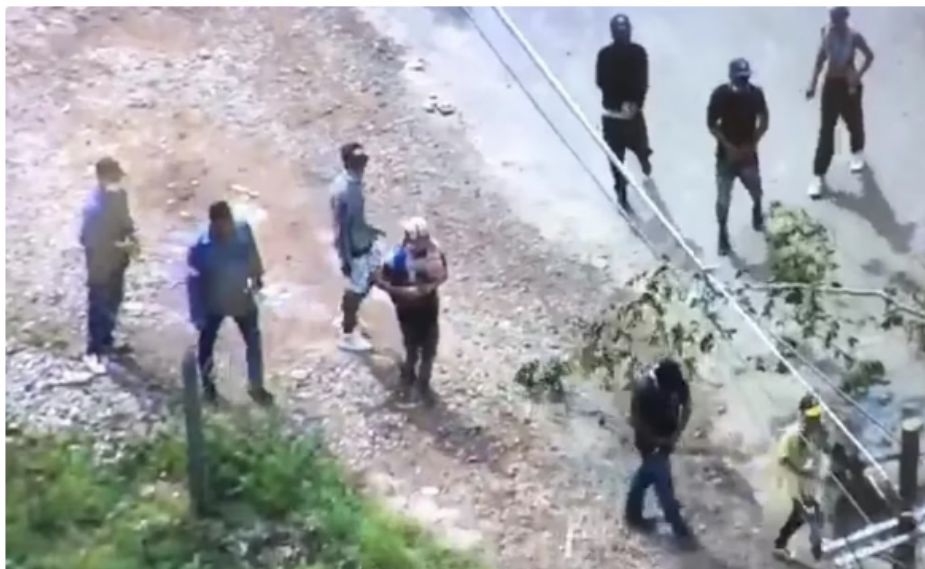
Desalojo de campesinos de un lote en Yondó, Antioquia

En total 14 uniformados resultaron heridos , de los cuales siete fueron trasladados a centros asistenciales a Barrancabermeja y uno de estos por la gravedad de sus heridas fue remitido al Hospital Universitario de Santander .