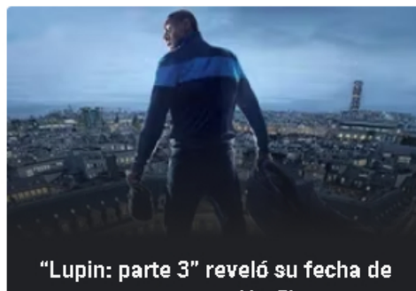
“Lupin: parte 3” reveló su fecha de