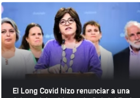
El Long Covid hizo renunciar a una