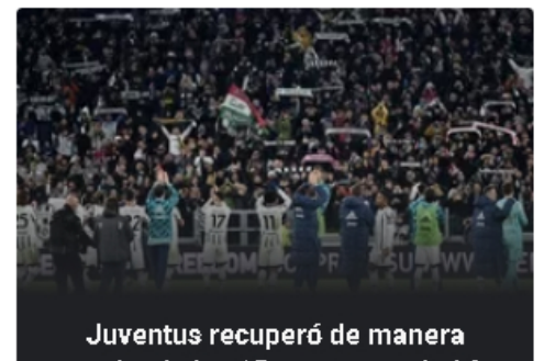
Juventus recuperó de manera